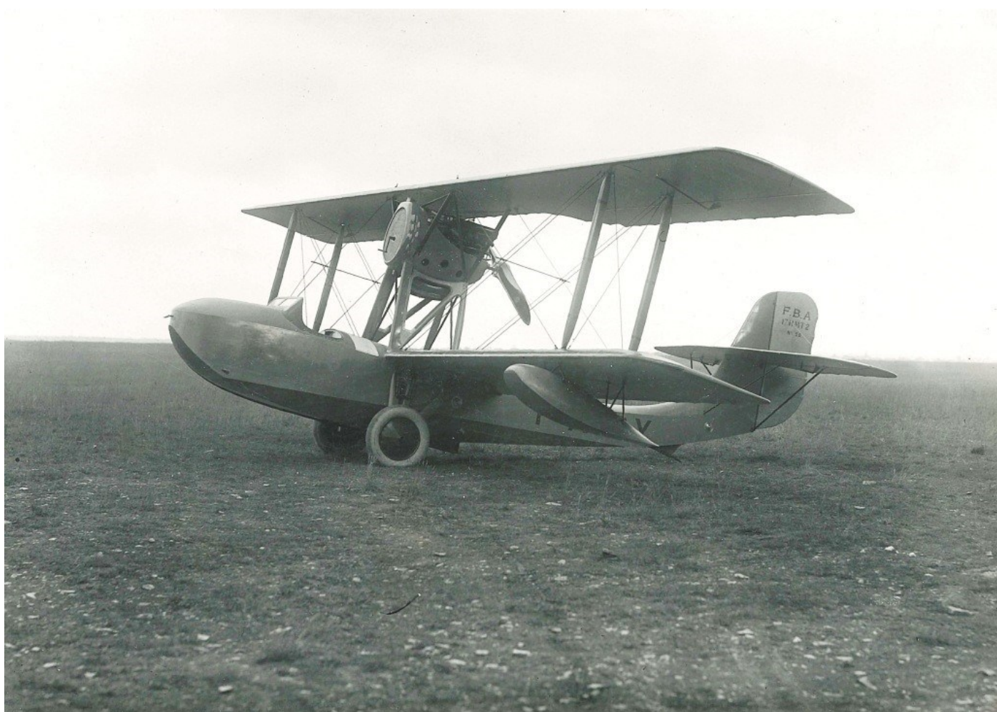
Avord 20 mai 1928

Le « F-AIPY » est un FBA Schreck 17 HMT2 (Constructeur Registre Numéro 1200.56 de la Franco-British Aviation Company, Argenteuil) certifié et immatriculé et plus tard modifié FBA 17 HE2.