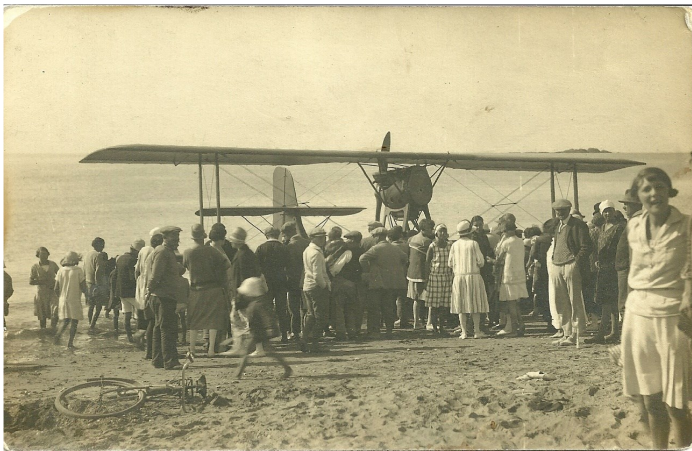
Carte postale « Croix-de-Vie, plage de Boisvinet, hydravion en panne d'essence 1927 »

Il est possible de douter de la véracité de la date indiquée au stylo bille au verso de cette carte postale. L'année 1928 semblerait plus vraisemblable, un hydravion identique à celui de la photo ayant été immatriculé le 22 mai 1928 à Argenteuil.